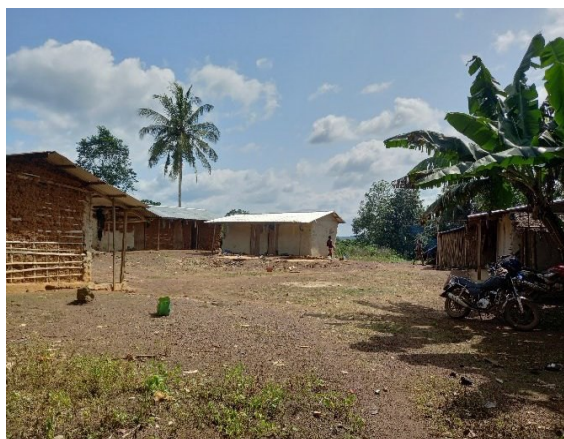
Un piccolo agglomerato di capanne

Il Club intende proporre un global grant relativo all'istallazione di impianti fotovoltaici a favore delle zone rurali di Ayamé, in Costa d'Avorio. Siamo in attesa delle dichiarazioni d'interesse da parte delle autorità locali e della formalizzazione dell'adesione del club locale, il RC di Abidjan.