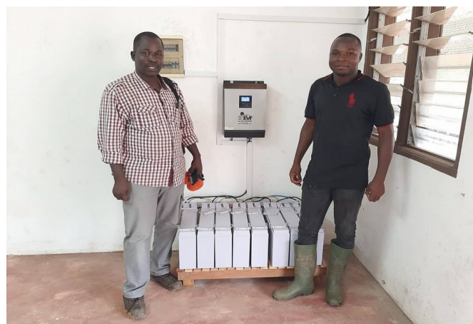
Installazione di un impianto fotovoltaico nella zona di Ayamé