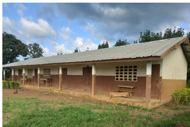
Una scuola rurale

Gli impianti saranno a disposizione degli abitanti delle zone rurali, delle scuole e delle strutture sanitarie locali.