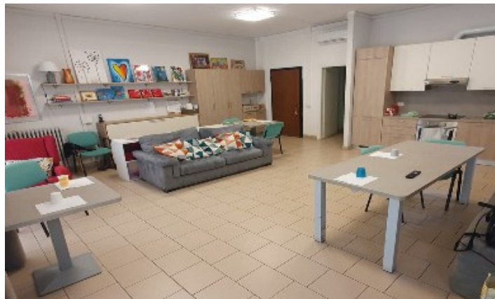
Due stanze della "Casa di Via dei Liguri", dove "Un nuovo dono" ospita i suoi assistiti.

Accanto a questo progetto il Club sta prendendo altre iniziative a favore di ANFFAS e "Un nuovo dono". E' stato contattato il Comune di Pavia al fine di reperire una nuova abitazione per le persone con disabilità, sia per ANFFAS che per "Un nuovo dono". Infine, l'attuale struttura utilizzata da ANFFAS necessita di interventi manutentivi al tetto e alle grondaie e di sanificazione per eliminare dalle pareti l'umidità che risale dal terreno. Ancora una volta è stata richiesta la collaborazione del Comune di Pavia.