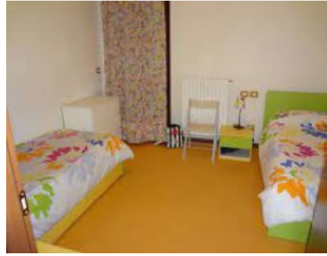
Due stanze della "Casa satellite", dove ANFFAS ospita i suoi assistiti.